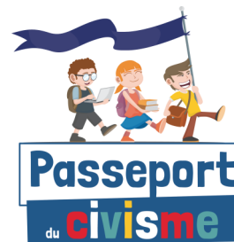
Cinquième année du Passeport du Civisme