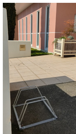
Range-vélos à la Mairie

Monsieur le Maire propose de faire une demande de subvention de 30% du montant des travaux au titre de la Dotation d'Équipement des Territoires Ruraux (DETR), soit 61 350 € et une autre de 20 % au titre du Fonds Régional Jeunesse et Territoires, soit 40 900 €.