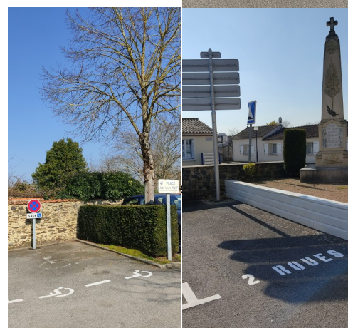
Peintures refaites sur les places Jean-Louis PAJOT et Emile MEYER avec création d'un espace pour les 2 roues.