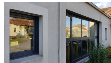
Fenêtres du restaurant scolaire

Le Conseil Municipal accepte la mise à disposition des services Vendée Grand Littoral, à compter du 1er septembre 2021.