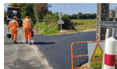
Travaux de voirie à la Tranquillité