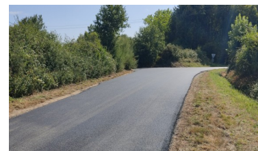
Travaux de voirie à la Planche