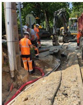
Rue de la Fontaine

Cet été, plusieurs travaux ont été réalisés rue de la Fontaine et dans le bourg: