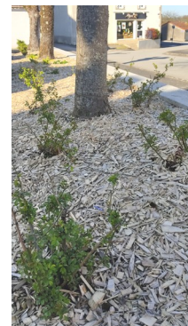
Plusieurs plantations dans la commune