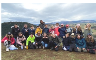
Classe découverte des CM2 à Murat Le Quaire (63) du 20 au 24 mars avec découverte des sites volcaniques (Puy de Vichâtel, Puy de la vache, Maar de Servièrre) et de la vie en collectivité