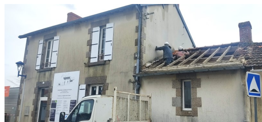
Travaux de couverture à l'école publique pour la réhabilitation du bâtiment

Le conseil approuve les conventions de maîtrise d'œuvre pour les études d'aménagement de la Coulée Verte et d'aménagement de liaisons douces (vélo).