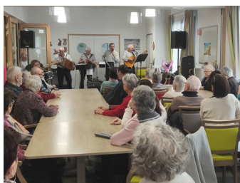
5 ans de la MARPA avec le groupe O'Beuzoune de Talmont Saint Hilaire

Ce début d'année a été marqué par les 5 ans de la MARPA. Les résidents, le personnel et les bénévoles ont profité d'un après-midi en musique animé par le groupe O'Beuzoune de Talmont Saint Hilaire.