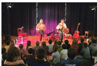
Spectacle de La Soulière sur le folklore vendéen